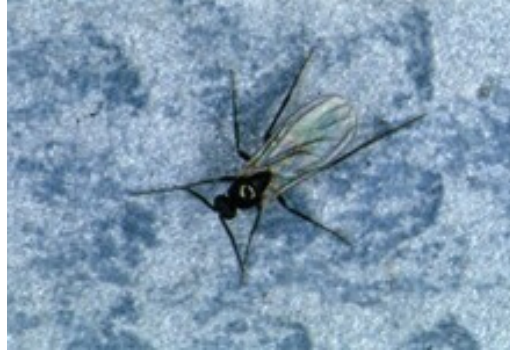
Imagen 1: Mosca del mantillo adulta.

Las larvas de la mosca del mantillo se suelen encontrar en las 2 a 3 pulgadas superiores del medio de cultivo, según el nivel de humedad. Principalmente se alimentan de hongos, algas y materia de plantas en descomposición. Sin embargo, las larvas se alimentarán en raíces y hojas de plantas que yacen sobre la superficie del medio de cultivo. Las larvas se desarrollan rápidamente y alcanzan el crecimiento completo a las tres semanas. Luego pupan dentro o