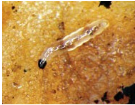
Imagen 4: Larvas de mosca del mantillo sobre una rodaja de patata.

Una forma eficaz para detectar la presencia de larvas de mosca del mantillo es insertar rodajas de 1/4 de pulgada o cuñas de patatas en el medio de cultivo. Las larvas migrarán a la patata y empezarán a alimentarse en unos pocos días. Las rodajas de patatas deberían darse vuelta para buscar la presencia de larvas en el otro lado.