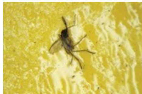
Imagen 3: Mosca del mantillo en un papel adhesivo.

La estrategia más importante para minimizar problemas con la mosca del mantillo asociadas con plantas de interior es permitir que el medio de cultivo se seque entre riegos, sobre todo de 1 a 2 pulgadas superiores. El medio de cultivo seco disminuirá la supervivencia de los huevos depositados y/o larvas que eclosionan de los huevos además de reducir el atractivo del medio de cultivo para las hembras adultas que ponen huevos. Además, se recomienda cambiar la tierra de la maceta con frecuencia, sobre todo cuando el medio de cultivo está “descompuesto” y retiene demasiada humedad. Asegúrese también de remover cualquier recipiente con una